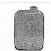
試験品噴霧器の形態【SX-100S(星...